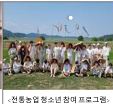
&lt;전통농업 청소년 참여 프로그램&gt;