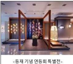
&lt;등재 기념 연등회 특별전&gt;

→ 「인삼산업법」에 인삼재배와 약용문화 계승·발전을 위해 활동하는 단체에 대한 정부 및 지자체 지원 근거 → 고려인삼의 세계역사 속 정치·사회·경제 등의 문화유산으로서 역사자료를 발굴·수집, 재조명을 통한 홍보 활동 강화